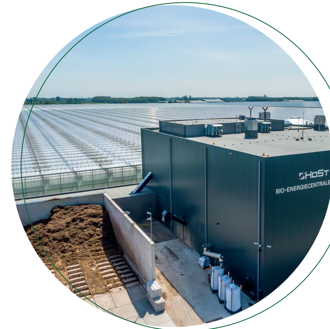
Beispielhaftes Biomasse- heizkraftwerk der Firma HoSt aus Bommel, Niederlande.

Aufgrund einer Fernwärmestudie der Stadt Ilsenburg sind Abschätzungen zum Wärmebedarf bekannt. Die Kraftwerksleistung wurde auf 16 MW thermisch / 4 MW elektrisch optimiert und kann damit die Haushalte der Stadt Ilsenburg mit Wärme versorgen.